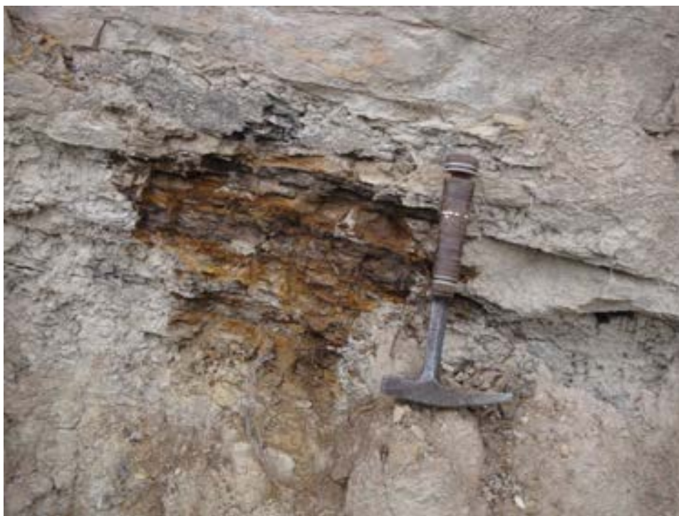
FOTOGRAFIA 3. PARADA 3

En aquest lloc, hi ha una antiga cabanya de vinya, construïda a partir dels materials gresencs de la Formació Artés. Aquesta cabana, de grans dimensions, es troba quasi totalment recoberta per la vegetació.