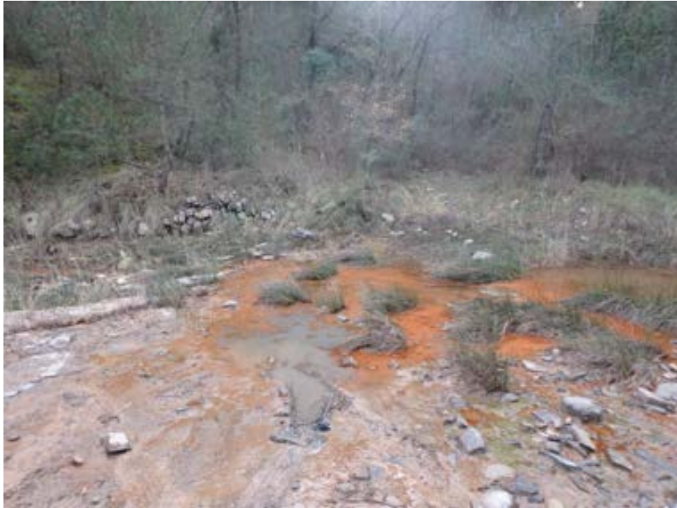
FOTOGRAFIA 5. PARADA 5

Ecosistema, molt ferruginós adaptat a la salinitat de les aigües. Font Salada. Torrent Salat. Horta d'Avinyó. Depressió Geològica de l'Ebre