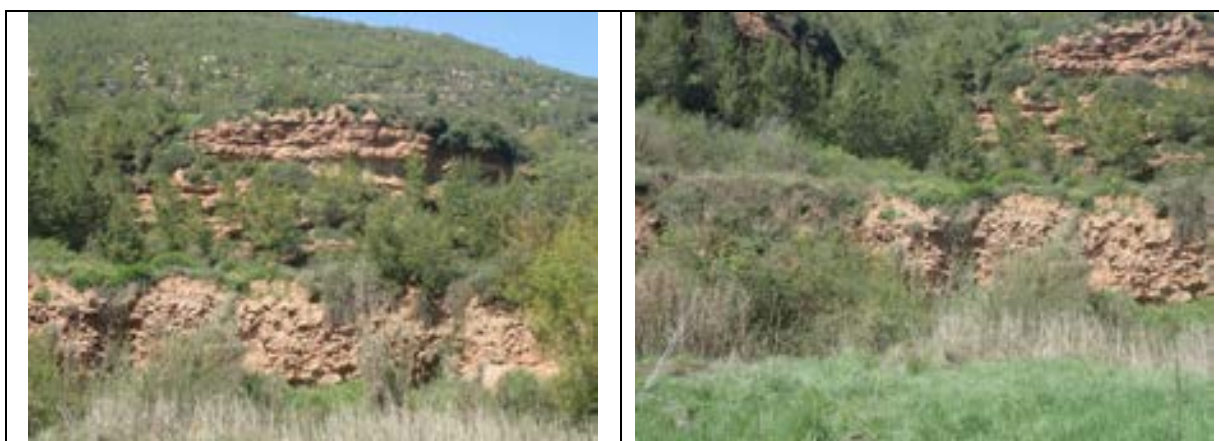
FOTOGRAFIES 17 i 18. CAMÍ ALTERNATIU CAP ELS MANXONS

En aquest cas, baixant directament, per un indret no gaire ben marcat, podríem observar sediments recents, procedents dels materials arrossegats pel Barranc de Jaumandreu, molt prop dels Manxons. FOTOGRAFIES 19 i 20