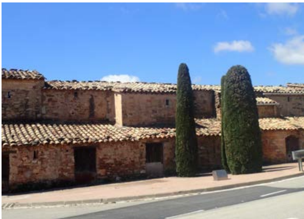
FOTOGRAFIA 2. PARADA 1 Un altre aspecte dels Manxons. Callús

En aquest indret hi ha les restes d'un conjunt de tines, que properament seran restaurades. Per d'altra banda, per aquí es troba el camí de la sal , procedent de Cardona. FOTOGRAFIES 1 i 2.