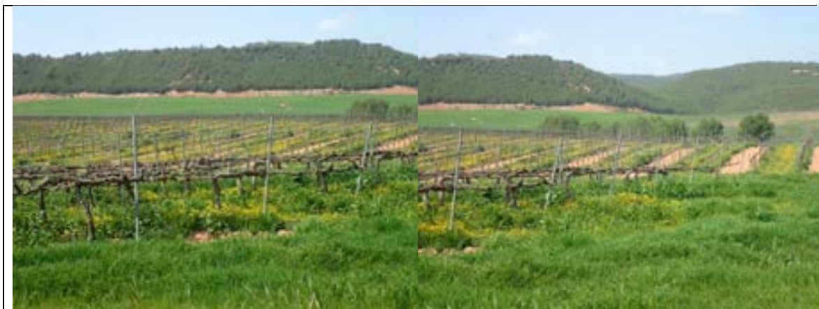
FOTOGRAFIES 13 i 14. PARADA 6 Dos aspectes de les vinyes de Jaumeandreu Afloraments dels materials rogencs de la Formació Artés . Depressió Geològica de l'Ebre. Fonollosa

Es tracta de materials d'origen continental, lacustres, els quals reblen la Depressió Geològica de l'Ebre, per aquests indrets del Geoparc de la Catalunya Central. En aquest indret, hi ha unes plantacions de vinyes, situades sobre els esmentats materials de la Formació Artés. FOTOGRAFIES 13 i 14.