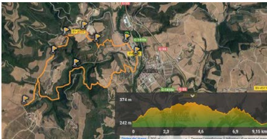
MAPA 1 DEL RECORREGUT DE L'ITINERARI (Mapa satelital del Google, sobre Wikiloc)

Posteriorment, camí de Callús, tornarà a pujar fins als 344 metres, baixant després fins als 242 metres, en arribar fins al riu Cardener i a la carretera BV – 3003, al pont sobre el riu. Finalment, en retornar als Manxons, es tornarà a l'alçada dels 257 metres, de l'inici del recorregut a peu d'aquest itinerari.