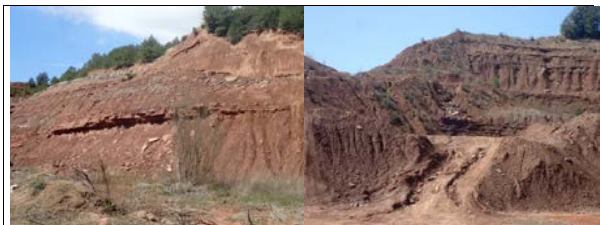
FOTOGRAFIES 7 i 8. PARADA 4 Dos aspectes de les explotacions de calcolutites Afloraments dels materials rogenqs de la Formació Artés . Depressió Geològica de l'Ebre . Callús

En aquest trajecte, hem trobat afloraments dels materials que hem vist a l'aturada anterior. Haurem vist un nivell carbonatats, per sota d'on discorre el camí (al principi). Després haurem vist nivells de calcolutites rogenques, que han estat explotades. FOTOGRAFIES 7 i 8.