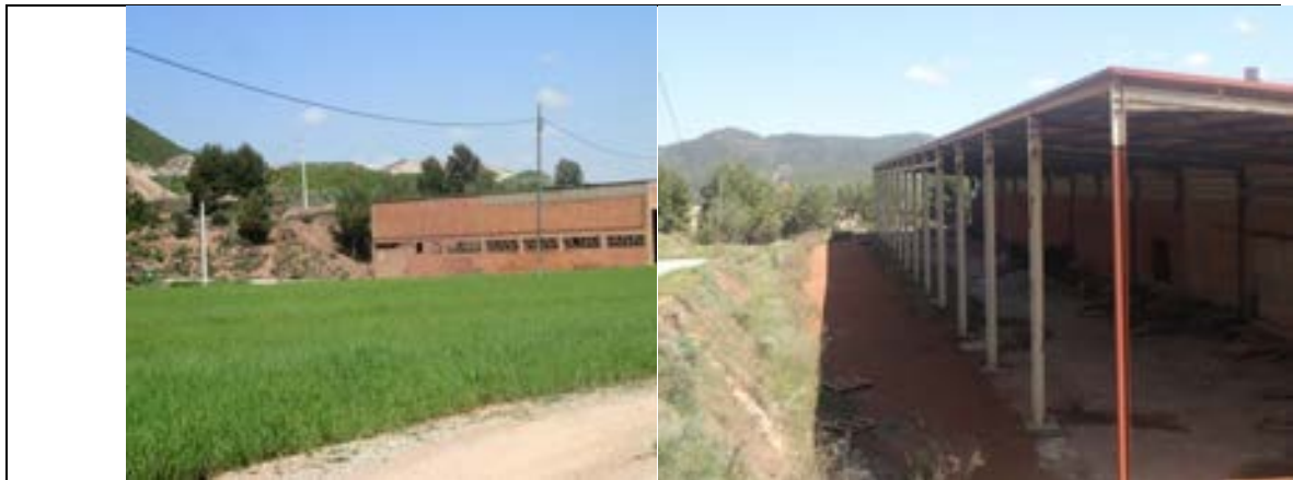
FOTOGRAFIA 5. PARADA 3 Restes de l'antiga fàbrica de Ceràmiques Manresanes . Callús