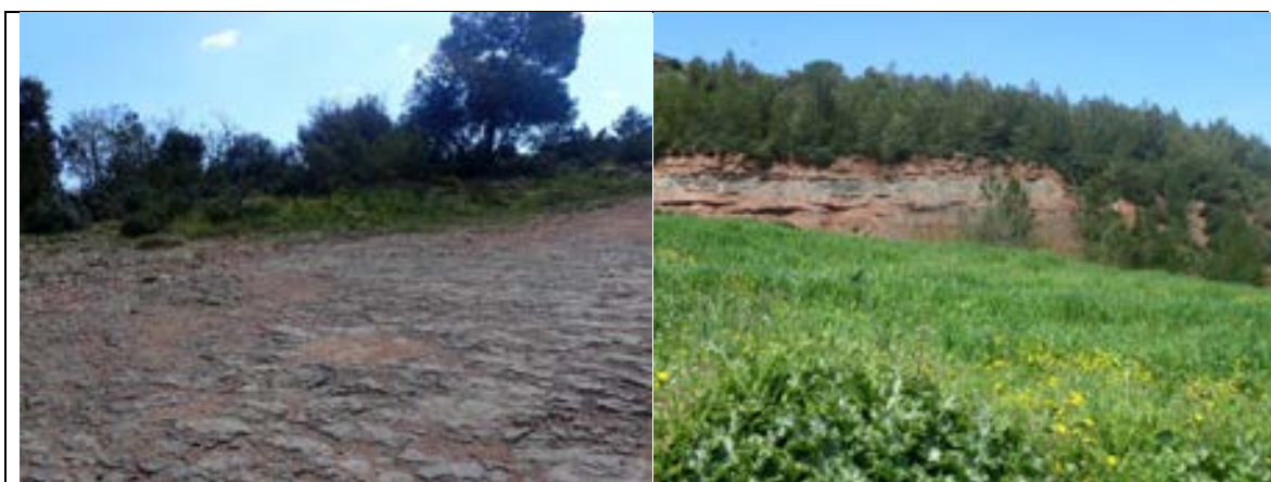
FOTOGRAFIA 9. PARADA 5 Aflorament de nivells de gresos carbonatats de la Formació Artés . Fonollosa

En aquest trajecte, hem anat trobant afloraments dels materials calcolutítics de la Formació Artés (que aquí pertany a l'Eocè). Així, hem vist nivells de calcolutites i de gresos de tonalitats rogenques. També hem trobat. En arribar al pla, un nivell de materials carbonatats, intercalats entre els anteriors. Per sobre aquests materials carbonatats discorre el camí, en arribar al començament del pla, i també es fa força palès a l'esquerra del camí, al Nord del mateix. FOTOGRAFIES 9 i 10.