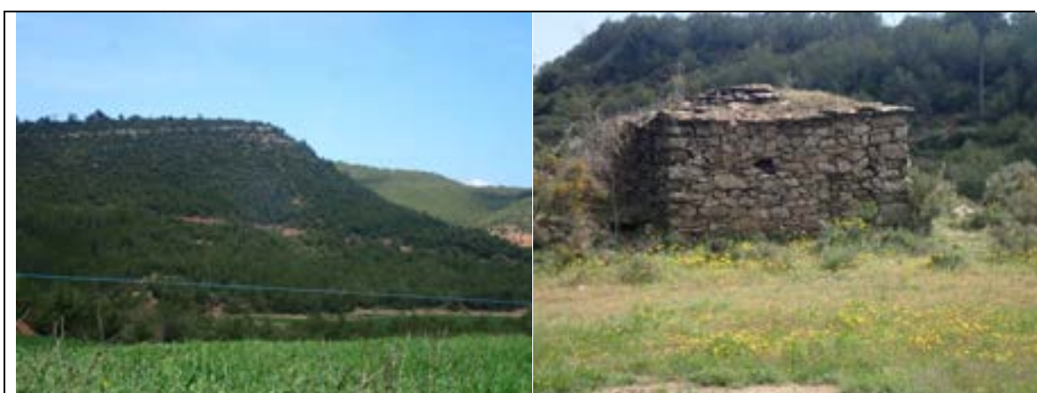
FOTOGRAFIA 11. PARADA 5 Relievs en cuesta . Materials de Formació Artés . La Polgada . Fonollosa