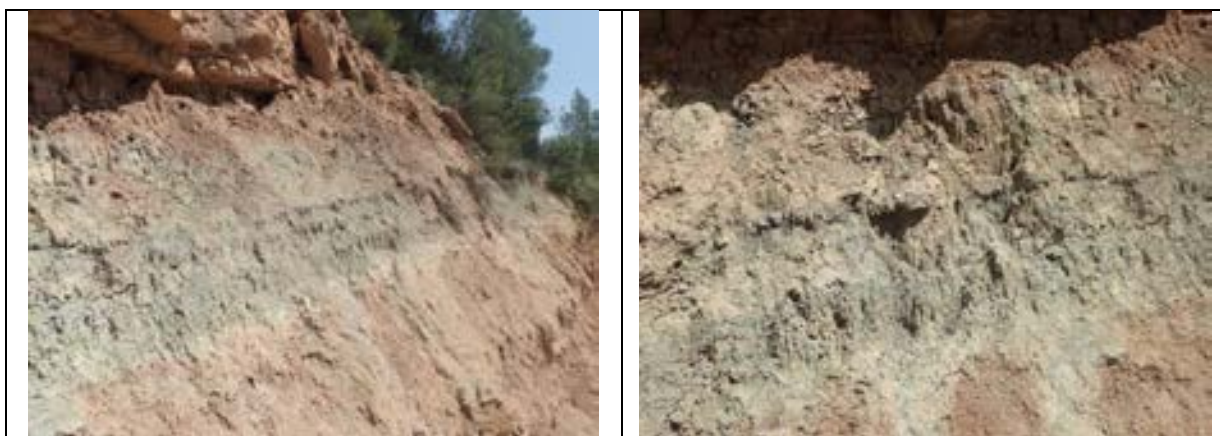
FOTOGRAFIES 15 i 16. PARADA 7 Materials de Formació Artés . Es fa palès un nivells de calcolutites grisenques molt carbonatades. Torrent de Jaumandreu (part alta). Fonollosa Depressió Geològica de l'Ebre

En aquest recorregut, hem anat trobant afloraments dels materials esmentats a les aturades anteriors. Així, hem vist nivells de calcolutites rogenques de la Formació Artés . També hem vist nivells de gresos, corresponents a paleocanals. I tanmateix, hem trobat nivells força carbonats, amb calcolutites grisenques molt riques en carbonat càlcic, com a l'inici de la baixada. FOTOGRAFIES 15 i 16.