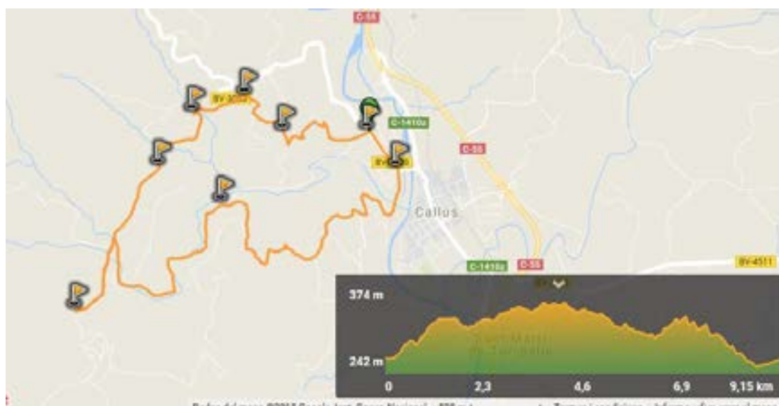
MAPA 2 DEL RECORREGUT DE L'ITINERARI (Mapa del Google, sobre Wikiloc)