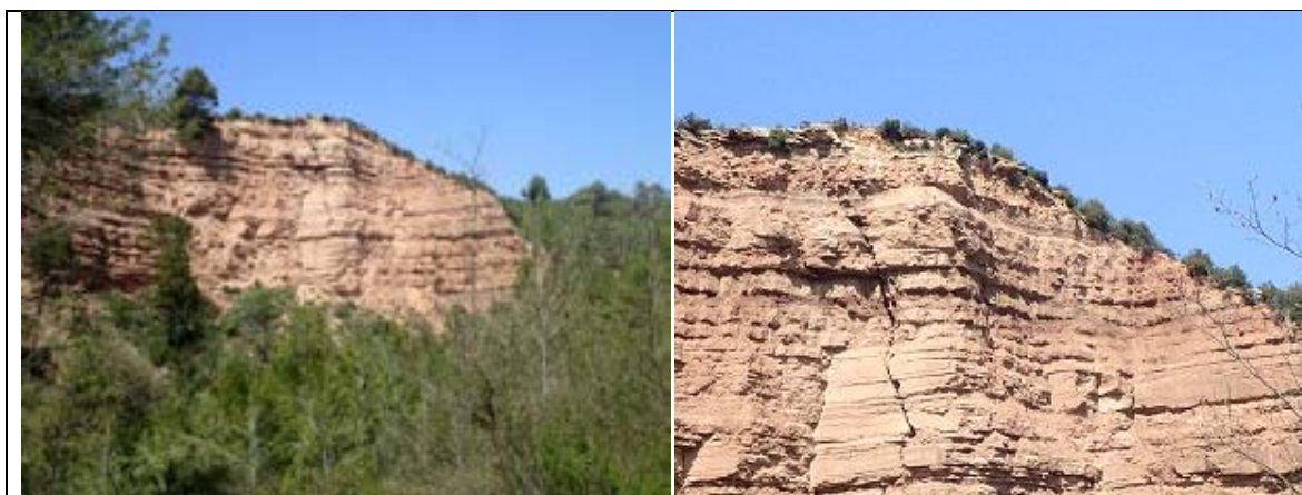
FOTOGRAFIA 17. PARADA 7 Nivells de calcolutites rogenques de la Formació Artés . Torrent de Jaumeandreu . Callús Depressió Geològica de l'Ebre

Tanmateix, més avall, hem trobat uns afloraments molt espectaculars dels materials rogenchs de la Formació Artés , a la riba septentrional del Barranc de Jaumandreu . Observant aquests materials, es pot veure una gran fractura que els talla. Això podria ser la causa d'un important desprendiment. FOTOGRAFIES 17 i 18