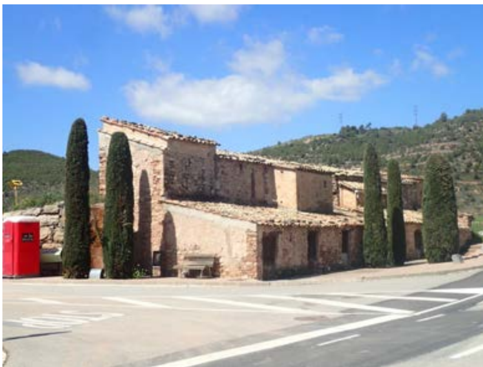
FOTOGRAFIA 1. PARADA 1 Aspecte lateral dels Manxons. Callús

El recorregut de l'itinerari s'iniciarà al bell mig de la població de Callús; concretament per les immediacions del seu Ajuntament. Des d'aquí, caldrà fer un breu recorregut per dintre de la població (seguint l'antiga carretera comarcal C – 1410b). Seguint-la arribarem al pont sobre el Cardener, des d'on s'inicia la carretera local BV – 3003 (la qual es dirigeix cap a Sant Mateu de Bages i cap a Castelltallat). Seguint aquest vial, aviat s'arribarà als Manxons , per on es farà la primera aturada del recorregut d'aquest itinerari. Així, haurem efectuat un recorregut previ de poc més de 1'5 Km.