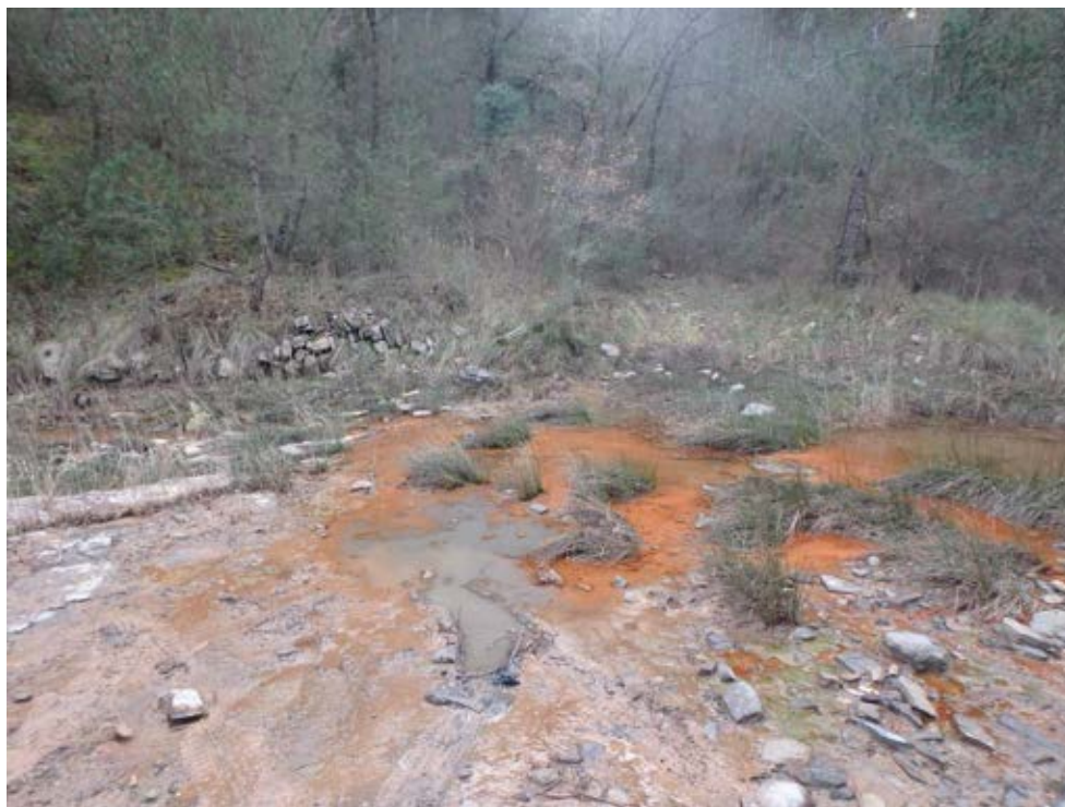
FOTOGRAFIA 5. PARADA 5

Petit saltant d'aigua entre els afloraments carbonatats de la Formació Artés . Horta d'Avinyó Ecosistema, molt ferruginós adaptat a la salinitat de les aigües Depressió Geològica de l'Ebre