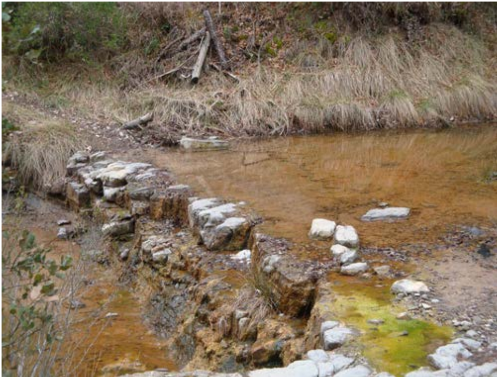
FOTOGRAFIA 4. PARADA 5

lixiviació dels materials de la formació Cardona .