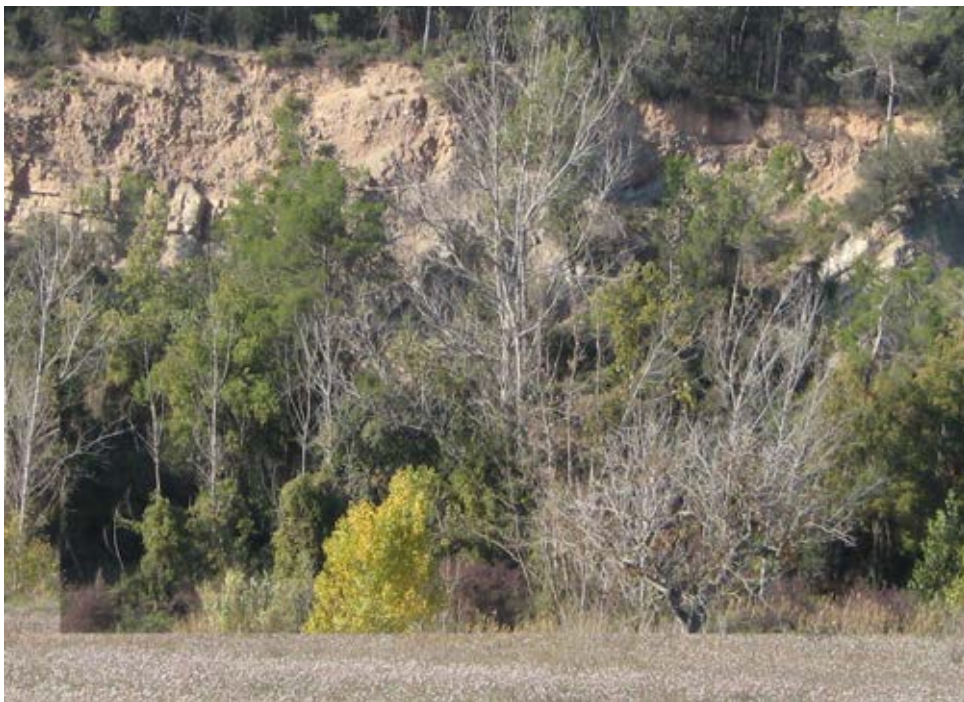
FOTOGRAFIA 1. PARADA 1

Aquí es pot veure una interessant plec, entre aquests materials acabats d'esmentar. Precisament, aquests materials es troben aquí plegats, tot formant part de l'Anticlinal de Santa Maria d'Oló. Tanmateix es pot observar clarament (malgrat la vegetació) la presència d'una falla entre aquests materials plegats. FOTOGRAFIA 1.