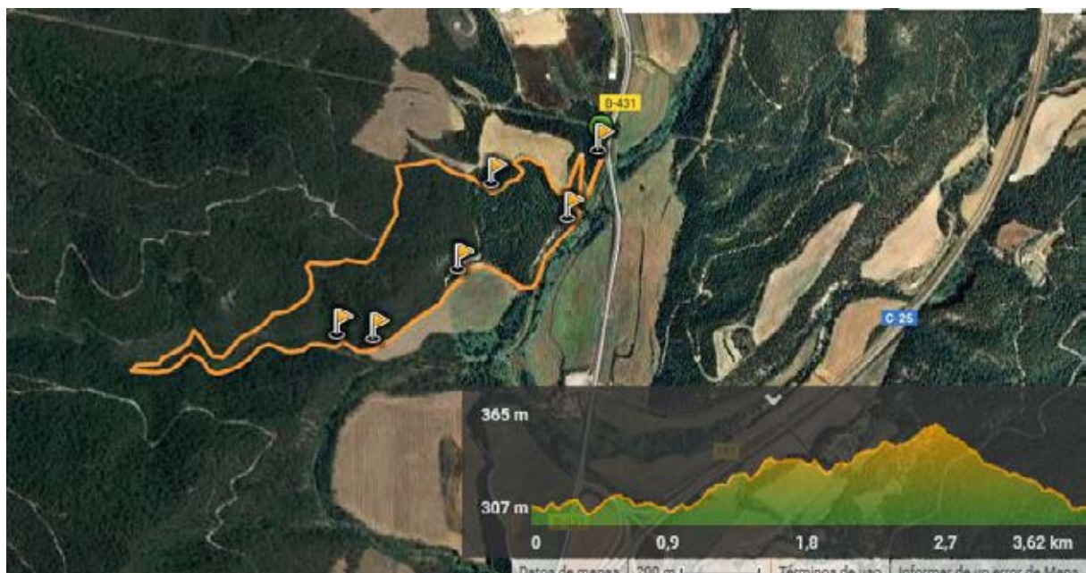
MAPA 1 DEL RECORREGUT DE L'ITINERARI (Mapa satelital del Google, sobre Wikiloc)

Tot això es pot veure també a: https://ca.wikiloc.com/rutes-senderisme/itinerari-geologic-pels-sectors-meridionals-del-terme-davinyo-voltants-de-la-font-salada-21629430