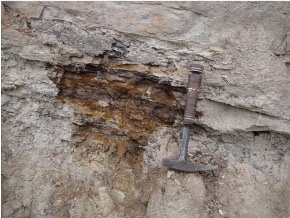
FOTOGRAFIA 3. PARADA 3

En aquest lloc, hi ha una antiga cabanya de vinya, construïda a partir dels materials gresencs de la Formació Artés. Aquesta cabana, de grans dimensions, es troba quasi totalment recoberta per la vegetació.