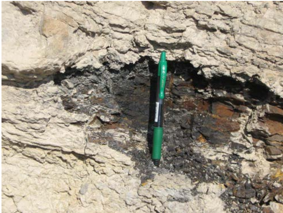
FOTOGRAFIA 2. PARADA 3

Per d'altra banda, en el recorregut cap aquest indret, a mig camí, aproximadament, haurem trobat l'aflorament d'uns nivellets de lignits, situats entre els afloraments dels nivells rogencs de la Formació Artés , entre les calcutites roges. Entre aquests materials, es fan molt evidents les mineralitzacions ferruginoses, amb presència de GOETHITA (terrosa i limonítica) i de MELANTERITA. Aquests minerals s'han format a partir de l'oxidació dels sulfurs de ferro primaris (PIRITA i MELNIKOWITA), presents entre els nivells de lignit, d'origen orgànic, com els propis lignits. FOTOGRAFIES 2 i 3.